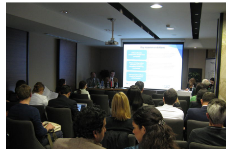
Од регионалната работилница на СЕЛДИ што се одржа во Белград

лијанскиот анти-мафија систем. Сепак, овој систем е високо политизиран, селективен во случаите на висока корупција и често пати не ја ужива довербата од граѓаните.